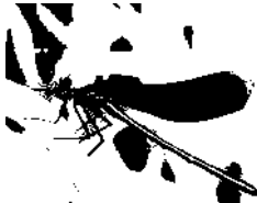
стрекоза 4 см