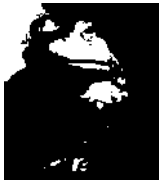
лягушка 10 см

Задание 4. Сравни размеры животных. Определи, кто всех длиннее .