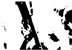
соловей 16 см